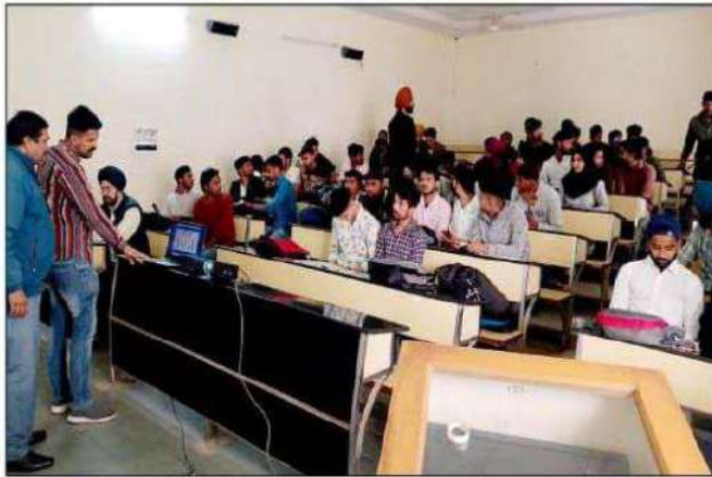
ਬਾਬਾ ਬੰਦਾ ਸਿੰਘ ਬਹਾਦਰ ਇੰਜੀਨੀਅਰਿੰਗ ਕਾਲਜ, ਫਤਿਹਗੜ੍ਹ ਸਾਹਿਬ ਵਿਖੇ ਉਦਮੀ ਵਰਕਸ਼ਾਪ ਨੂੰ ਸੰਬੰਧਨ ਕਰਦੇ ਹੋਏ ਪ੍ਰੋਫੈਸਰ ਸਾਹਿਬਾਨ।